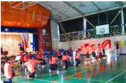
オープニングファンファーレに続き、吹奏楽部の演奏♪1年生は最前列で踊っています。圧巻の演奏、3年生はソロを披露しました。