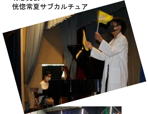
有志発表： 恍惚常夏サブカルチュア