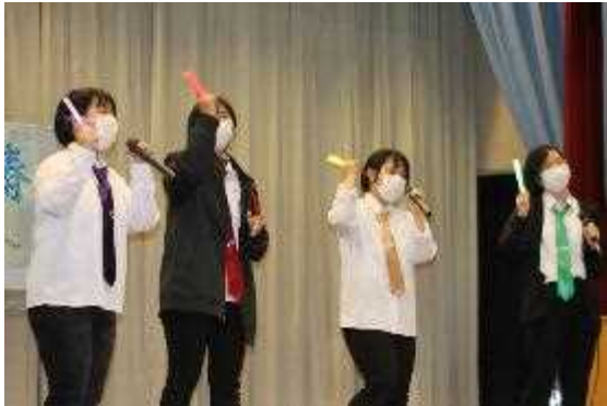
有志発表：通りすがりの中学生「めろらい」