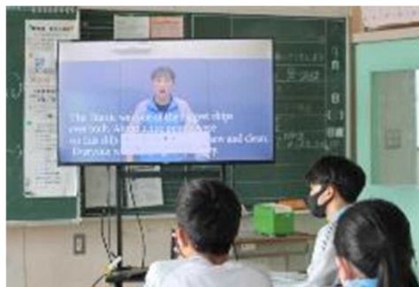
英語暗唱 & 英語弁論