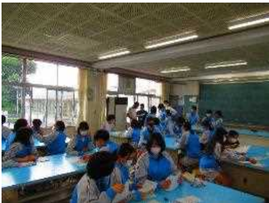
各学級から集めたスローガンを集計中