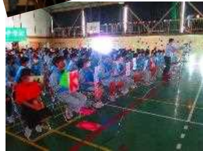
ステージ発表応援団