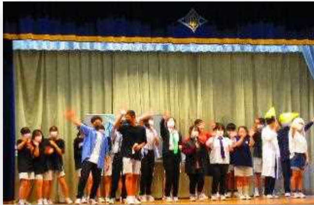
ステージフィナーレ！ 実行全員＋有志で、 「ありがとう～～」